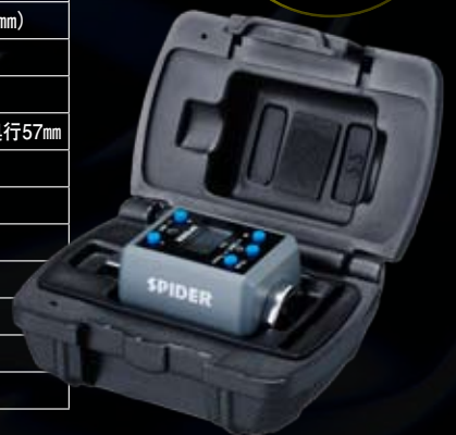
※ブローケース入り