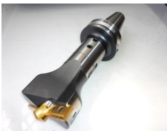
BTシャンクタイプ（延長型）