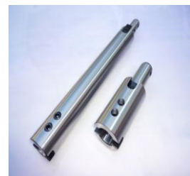
中間バー（エクステンションバー）