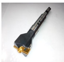
MTシャンクタイプ（延長型）