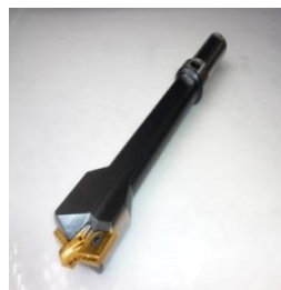
ストレートシャンクタイプ（一体型）